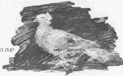
יונת השלום, ליטוגרפיה: פבלו פיקאסו

שלום הם אפשריים ובעלי חיות באופן שלא היה אפשר לאששם רק לפני שנים מועטות.